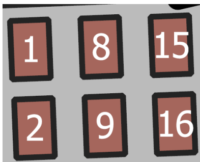
Obr. 2 Ukázka zakreslení urnových míst v kolumbáriu na mapě hřbitova