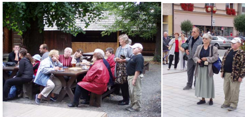
Dne 6. srpna 2005 uspořádala kulturní komise Obecního úřadu zájezd do Rožnova pod Radhoštěm na Jánošíkov dukát.

Všem přejeme hodně zdraví a mnoho úspěchů v dalším životě.