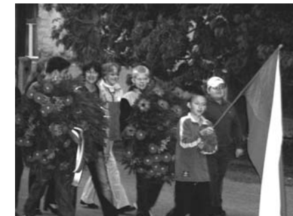
Jako každý rok, tak i letos se v naší obci uskutečnil lampiónový průvod zakončený pokládáním věnců u pomníků z první a druhé světové války.