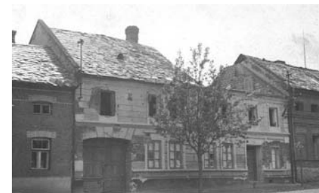
Těmito snímky připomínáme 59. výročí konce druhé světové války