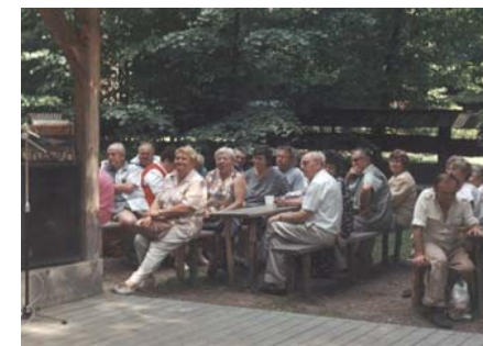
V sobotu 9. srpna se uskutečnil zájezd důchodců do Rožnova pod Radhoštěm.