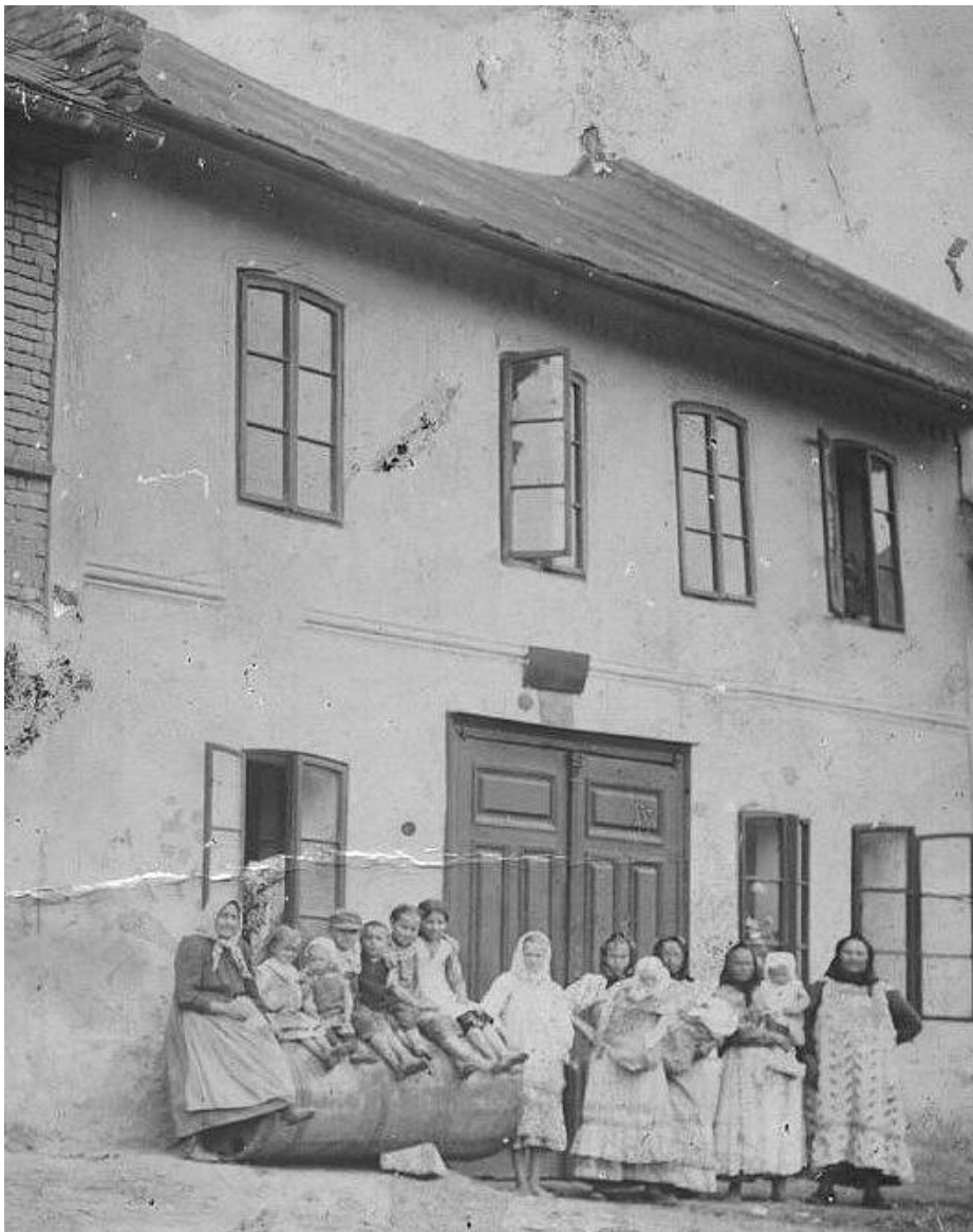
Vydává Obecní úřad v Klopotovicích v listopadu 2003; redakční tým: Zdeněk Klobouk a Petr Indrák; čerpáno z Archívu tovačovského panství a materiálů Obecního úřadu v Klopotovicích.