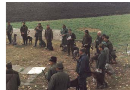
Dne 28. června se konaly střelby Agrární komory a 13. září podzimní zkoušky ohaňů a malých plemen psů.