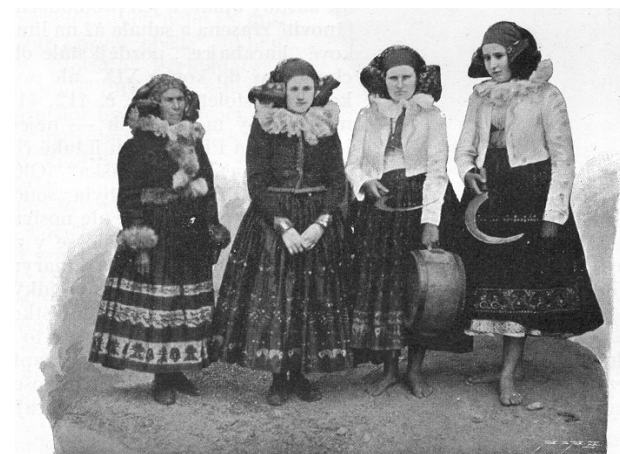
415. Kroje z Tovačovska. Tetička v „liščáku“, žena v „korálku“ a žnečka v bílých marynkách.