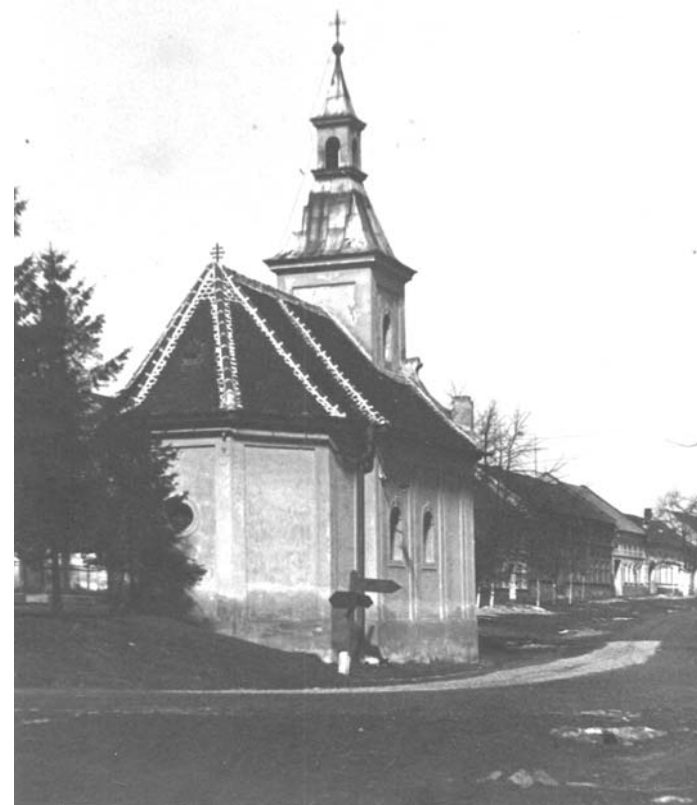
Obrázek kaple – autor Arnošt Polášek (asi v roce 1939/1940)

Občasník o minulosti a přítomnosti nejen naší obce Ročník IX číslo 2/2009