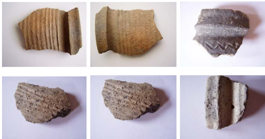
Střepty nalezené v Klopotovicích v nedávné době.

Nezávislý občasník o dění v naší obci srpen 2006