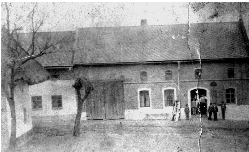
Na snímku z Hliníka asi z 20. let minulého století vidíme domy č. 38, 41 a naproti ještě v té době stála již zmíněná Jurdova kovárna.