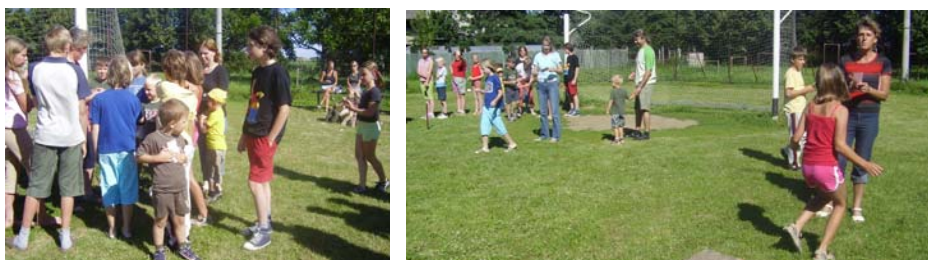
Dne 16. července se konal na hřišti dětský den

ZO Českého svazu žen tuto cestou děkuje všem, kteří svými dary přispěli ke zdárné oslavě dětského dne v Klopotovících.