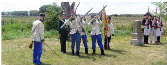
Dne 15. července se konala oslava 140. výročí Bitvy u Tovačova

ZO Českého svazu žen tuto cestou děkuje všem, kteří svými dary přispěli ke zdárné oslavě dětského dne v Klopotovících.