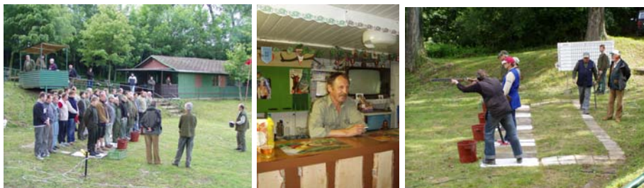
10. června se konaly jako každoročně střelecké závody na Podstrání.